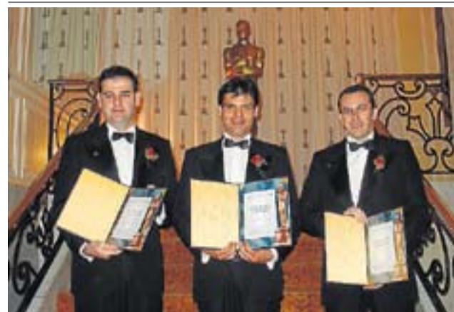
Los directivos de Next Limit tras recoger el Oscar.

Su descubrimiento sólo podía tener éxito en un lugar en el mundo: la meca de los efectos especiales. No se lo pensaron dos veces y se plantaron en una de las mayores ferias especializadas de Hollywood. Su logro gustó tanto que hasta les ofrecie-