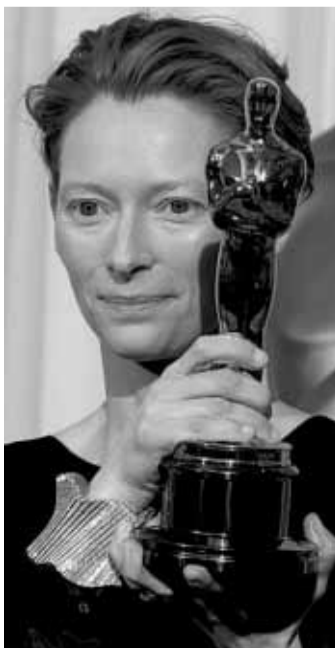
Tilda Swinton, con su Oscar

“Es un filme sobre seres humanos cometiendo actos inhumanos, demasiado sofisticado como para sugerir respuestas”, explicó la actriz semanas atrás a La Vanguardia sobre la película. Swin-