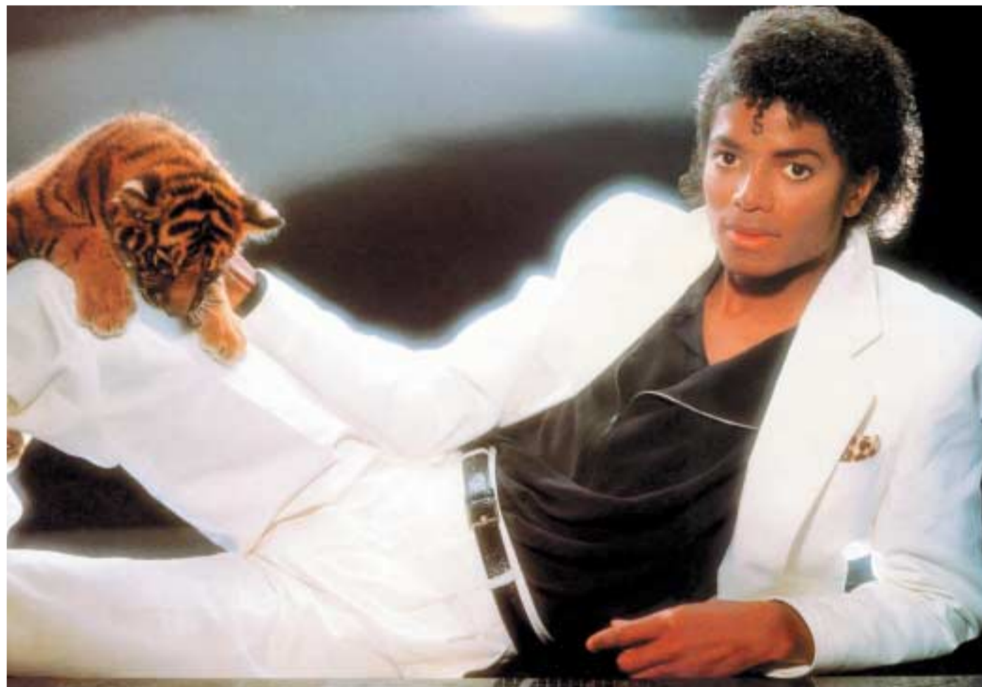
Michael Jackson hace 25 años, en un tiempo en el que revolucionó al mundo con sus bailes de zombie viviente en 'Thriller'.